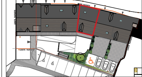
DUPLEX - RDC & 1er Etage